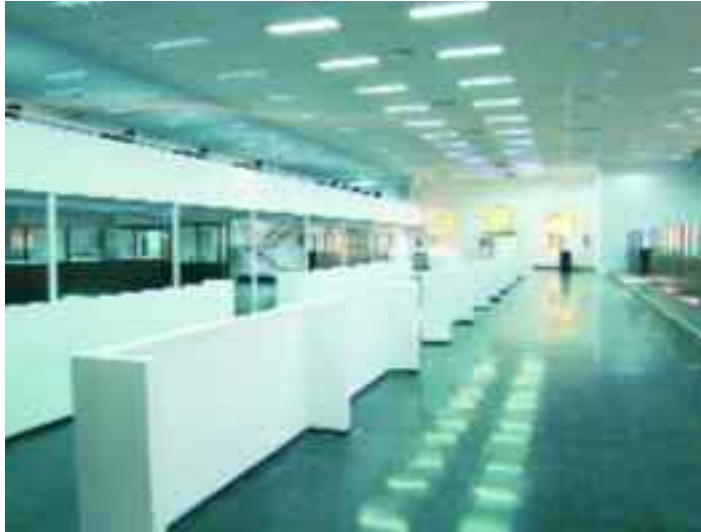
El interior, el día antes de abrirse al público. Abajo, el pasado