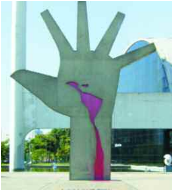
Memorial de América Latina, Museo Oscar Niemeyer, Brasilia

Hoy, como conjugando formación académica y experiencia personal, dedican su trabajo a la investigación de este movimiento transatlántico. Tanto desde su país de origen, siendo integrantes de la Red de Investigadores Argentinos sobre Migraciones Internacionales, del Programa Raíces del ministerio de Ciencia y Tecnología, como desde España, en el Grupo Interdisciplinario de Investigador@s Migrantes (Giim), realizan un riguroso análisis en el que coexiste el valor científico con el social. “Desde 2007, desarrollamos nuestra labor profesional desde Universidades y Centros de Investigación en España, Estados Unidos y América Latina. Investigamos los procesos migratorios, las políticas públicas y los medios de comunicación (...) desde una perspectiva crítica y transnacional, atendiendo principalmente a las migraciones latinoamericanas y su