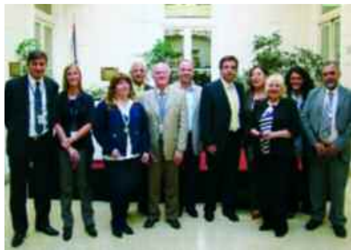
Algunos de los homenajeados con autoridades

Mientras que el público estuvo integrado por directivos de Migraciones, representantes