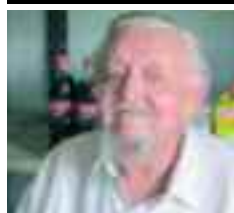
Un hombre de tierra adentro