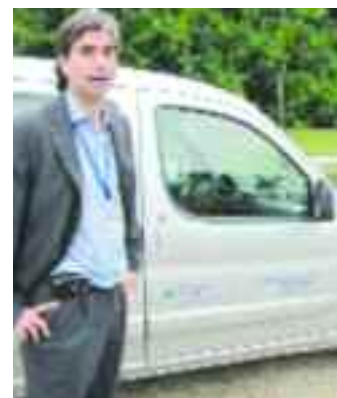
Operativo en un supermercado e Izura

Por otro lado, como se citó en tapa, las multas a los empleadores de inmigrantes irregula-