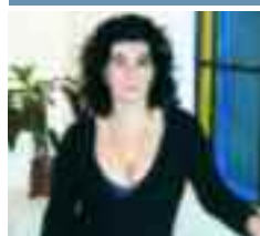
Una jugosa incomodidad