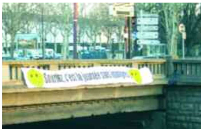
Un pasacalle elocuente: "Sonría, este es un día sin inmigrantes"

2010 fue un año perjudicial para los migrantes. En septiembre una expulsión masiva de gitanos recibió fuertes críticas internacionales. La ONU, la Comisión Europea, el Consejo de Europa y el Vaticano expusieron su desacuerdo. Ese