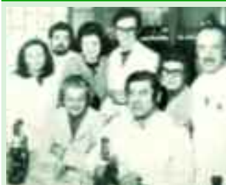
Hace tiempo atrás