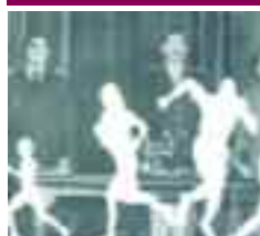
Morir lejos de casa