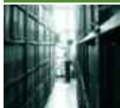
Más que mil palabras