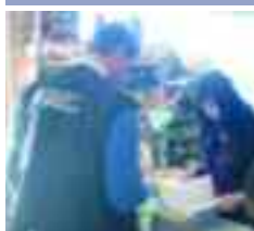
Otro sesgo en los controles